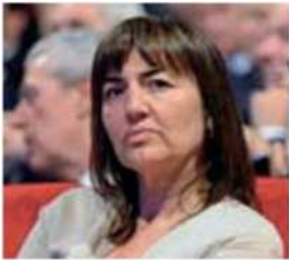
Governatrice Renata Polverini