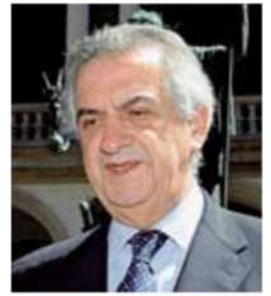
Ministro Lorenzo Ornaghi