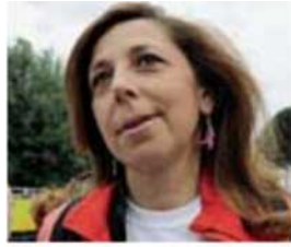
Pdl Isabella Rauti